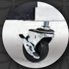
Ruedas de uso rudo. (como accesorio)