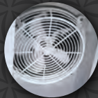
Enfriamiento por aire forzado.