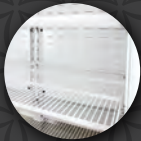
Parrillas de posiciones.