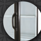
Puerta con triple cristal.