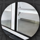
Piso de acero inoxidable.