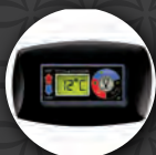
Control Inteligente de temperatura.